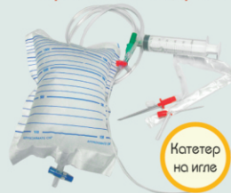
Катетер на игле

Оптимальные решения для безопасного торакального дренажа